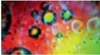
Bill Ham (*1932), Kinetic Light Painting, 2016–2017 Vier Farbfilme. Dauer: 64 Minuten.

Dog Saloon in Virginia City, Nevada, aufgeführt. Seine Werke waren immer Teil einer Theaterperformance, die auch Musik und Tanz umfasste, und simultan die Komposition, Ausführung und Wahrnehmung erforderten. Ham beschreibt seine Praxis als „das Ultimative in der partizipatorischen Kunst“: Räume, voller wirbelnder, pulsierender und farbiger Lichtprojektionen, die den Betrachter und das Werk in einer ganzheitlichen, harmonischen Erfahrung vereinen sollen.